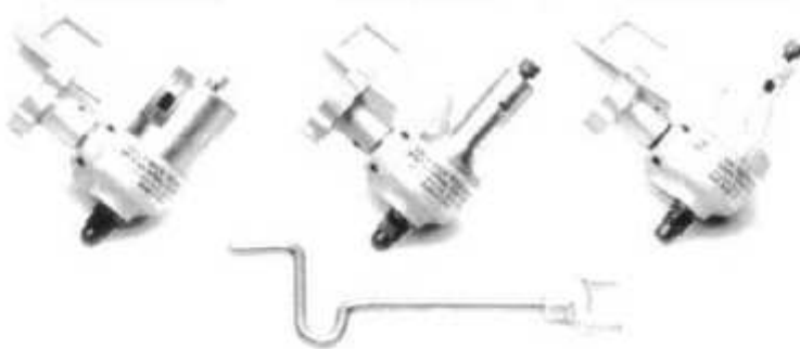
The No. A1-248-07 SHAPLANE Radius Tool turning a concave radius.