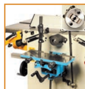
Table de mortaiseuse avec mandrin Wescott