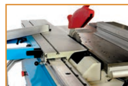
Chariot ras de lame