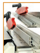
Guide parallèle de délignage